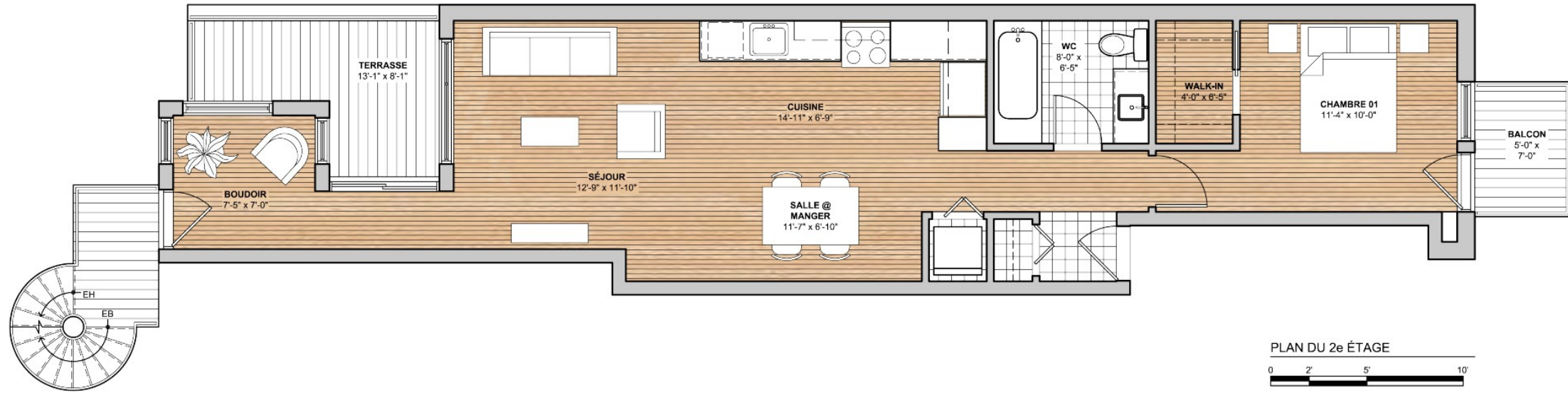
PLAN DU 2e ÉTAGE 0 2' 5' 10'